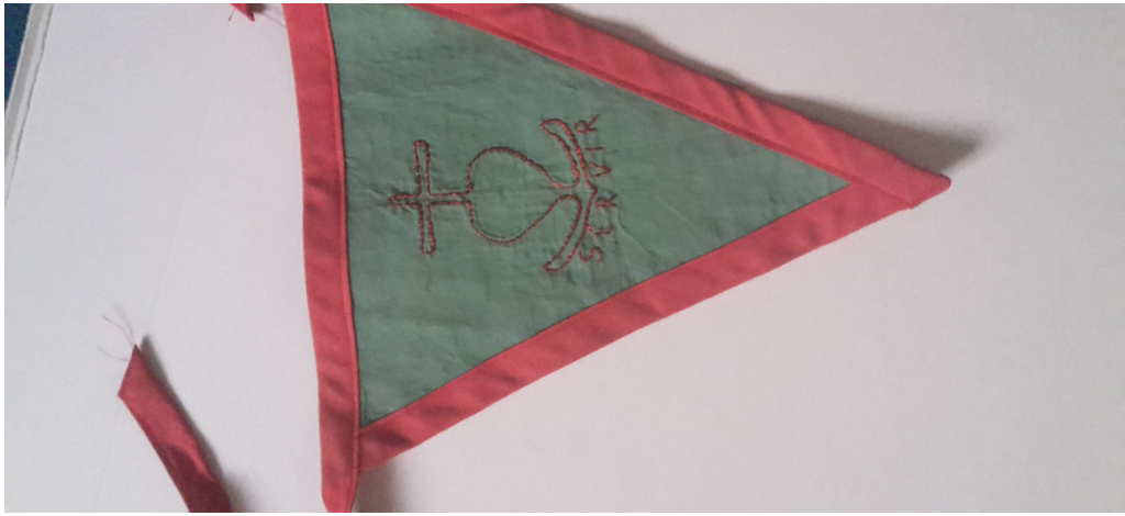
Exemple de Bâton de Clan de Route, et de fanion de Route