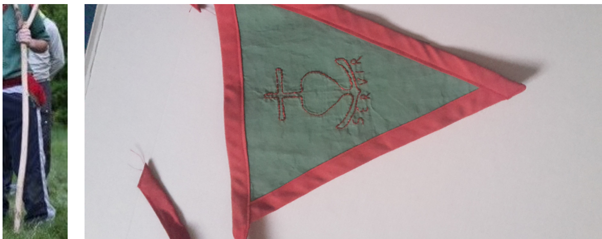
Exemple de Bâton de Clan de Route, et de fanion de Route