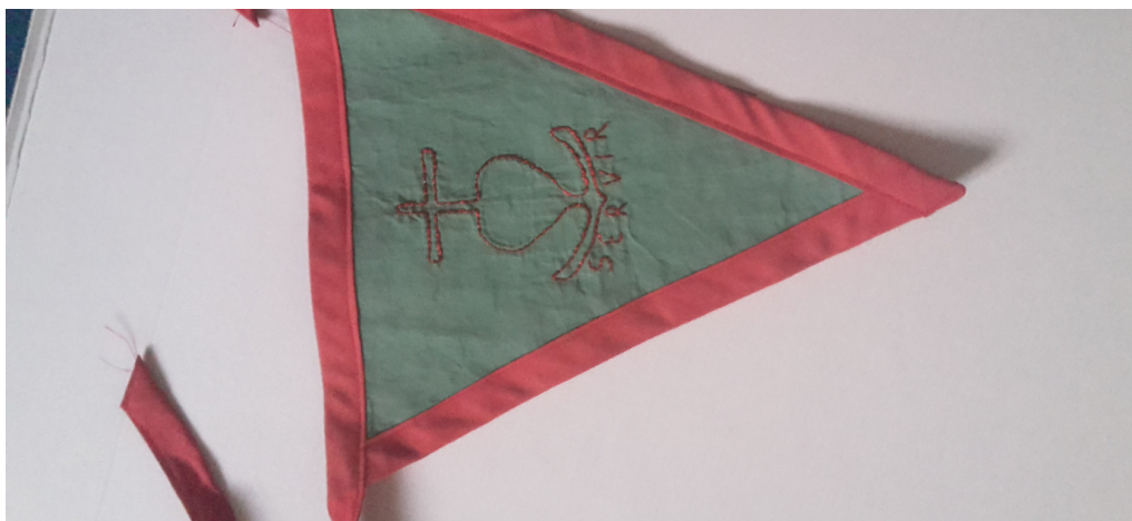
Exemple de Bâton de Clan de Route, et de fanion de Route