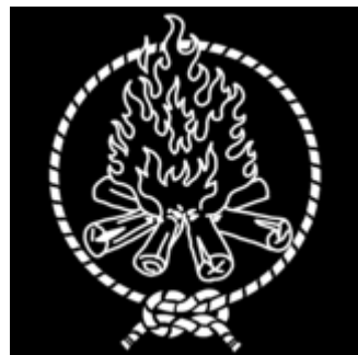
Pédagogie / Folklore